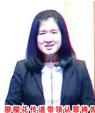
廖樱花传道带领认罪祷告