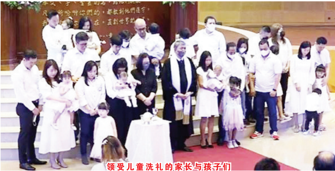
领受儿童洗礼的家长与孩子们