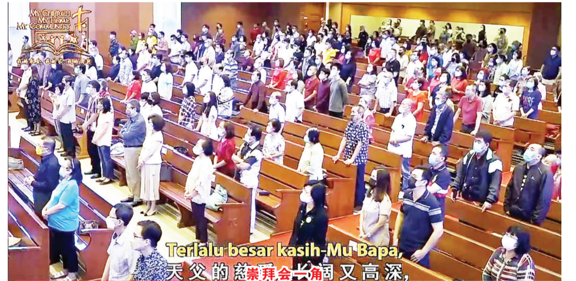
Terlalu besar kasih-Mu Bapa, 天父的慈爱崇拜会长调又高深